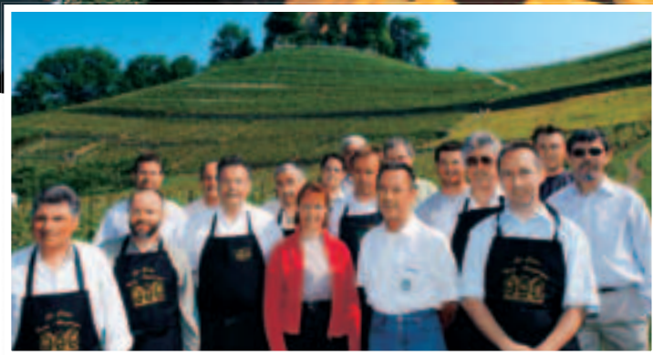
La Route gourmande, l'atout coeur du Groupement de promotion.