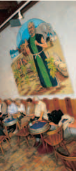
Le rendez-vous des amis du vin: le caveau Scanavin.